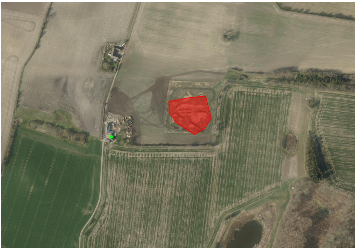
Figur 1 ønsket placering af vandhul

Langeland Kommune har modtaget ansøgning om tilladelse, efter planlovens § 35, til etablering af et vandhul, på omkring 5000 m 2 , på matrikel nr. 3d Assemose By, Longelse. Arealet hvor søen ønskes etableret tilhører ejendommen Assemose 6 5900 Rudkøbing. Indsatte kortbilag viser søens placering.